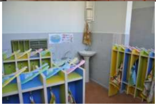
Группа общеразвивающей направленности № 12