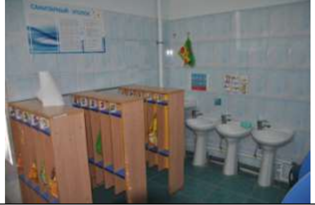
Группа общеразвивающей направленности № 7