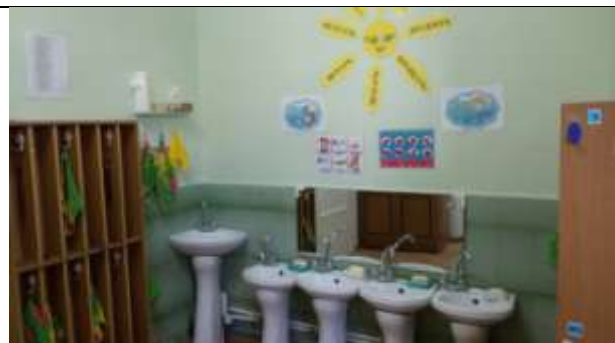
Группа общеразвивающей направленности № 13