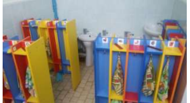
Группа общеразвивающей направленности № 11