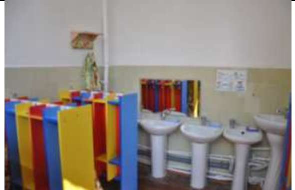
Группа общеразвивающей направленности № 8