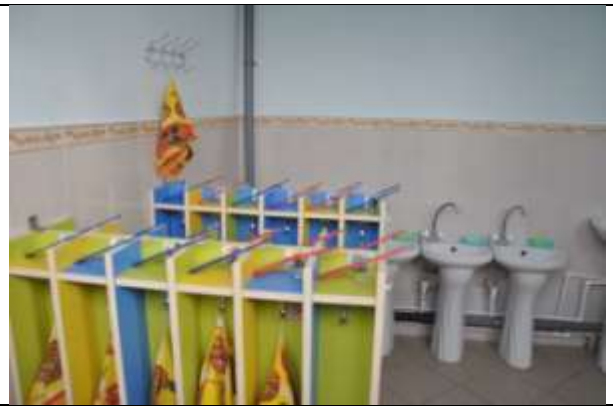
Группа компенсирующей направленности № 4