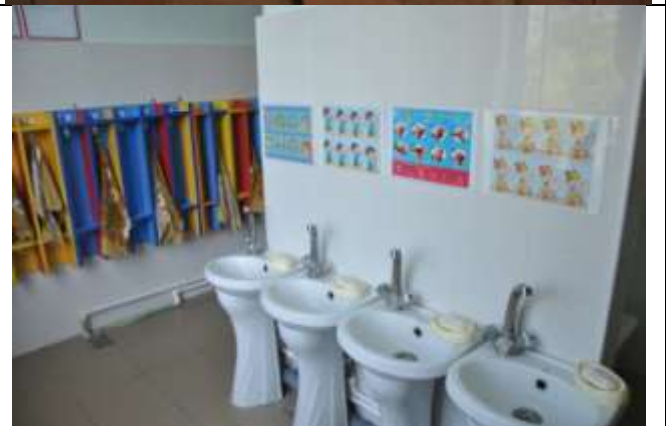
Группа общеразвивающей направленности № 10