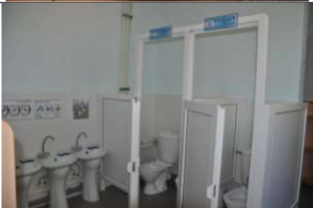
Группа компенсирующей направленности № 5